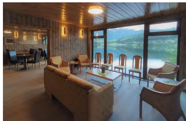
In de lounge kunt u uw avonden doorbrengen met het spelen van bordspellen of tv kijken, onder het genot van een drankje naar keuze.