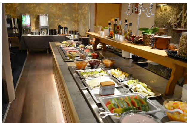
Ontbijt: Intercontinentaal, brood, croissants, vis, kaas, vlees, fruit, ontbijtgranen, glutenvrij en huisgeperst appelsap, warme dranken. Lunch: lunchpakket to go, of zelfbediening aan het buffet, koude salades, beleg, brood, warme soep, koude + warme dranken.