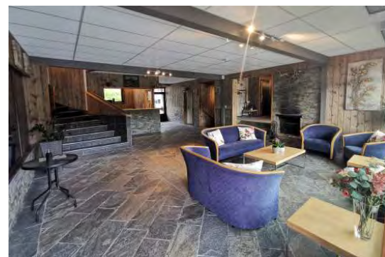
Chillen bij de receptie met après-ski "Glühwein", of een Belgisch bier, lokale cider of wijn.