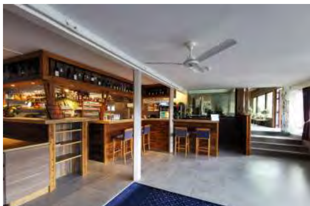
Haal een espresso bij de bar of een cocktail. Wij hebben meer dan 100 verschillende drankjes op de kaart staan.