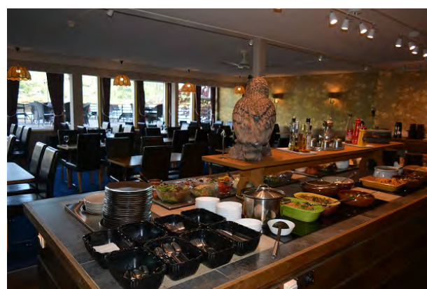
Diner: 3-gangen geserveerd aan tafel met wederom een prachtig uitzicht op de fjord. Drankjes niet inbegrepen.