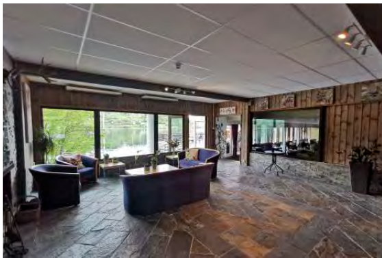
Die Lobby mit schöner Aussicht auf den Fjord. Entspannen Sie sich beim Betrachten eines lebenden Gemäldes.