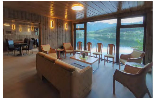
In der Lounge können Sie Ihre Abende mit Brettspielen oder Fernsehen verbringen und dabei ein Getränk Ihrer Wahl genießen.