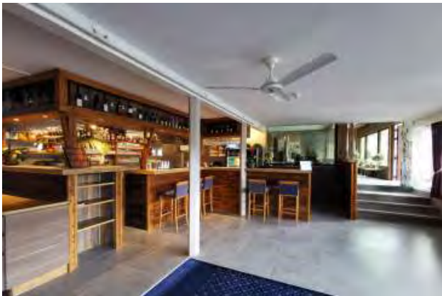
Holen Sie sich einen Espresso an der Bar oder einen Cocktail. Wir haben mehr als 100 verschiedene Getränke auf der Karte.