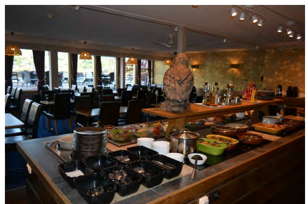
Abendessen: 3 Gänge, serviert am Tisch mit einem weiteren wunderschönen Blick auf den Fjord. Getränke nicht inbegriffen.