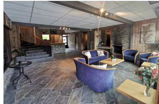
Entspannen Sie sich beim Après-Ski mit „Glühwein“ oder einem belgischen Bier, lokalem Apfelwein oder Wein.